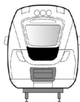
Vue de face/arrière